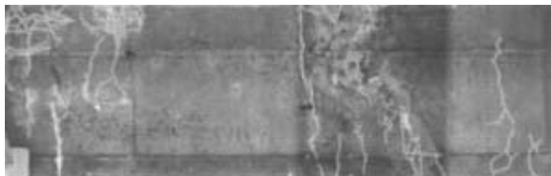
デジタルカメラによる画像