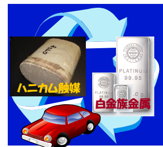
図2. 白金族金属を溶融銅に濃縮・回収するプロセスを研究