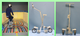
Personal Mobility Vehicle