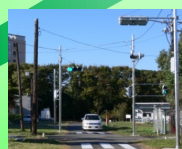
Experimental Traffic Light for ITS Research