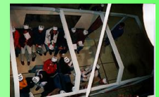
Railway Vehicle Mockup for Study on Comfort