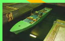
Ship Anti-Rolling System with Self-Powered Active Control