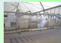
Variable-boarding-location-type Automatic Platform Gate