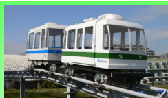
Eco transport system "Eco Ride"