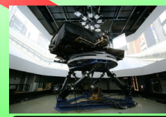
Driving Simulator with Truck Cabin