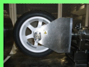
Tire Test Machine