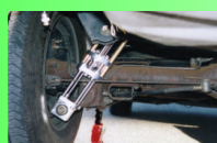
Electro Magnetic Suspension