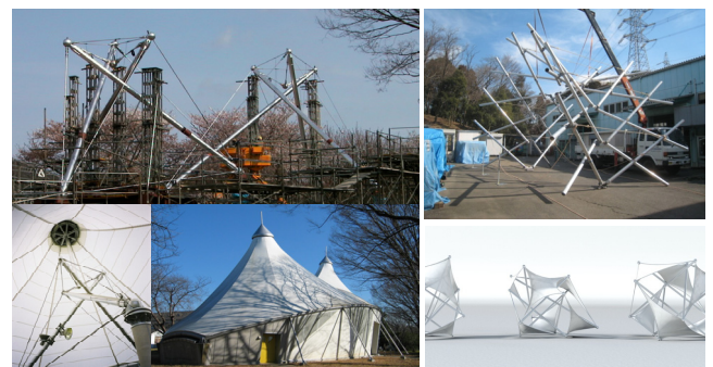
ケーブルによる天井の補強