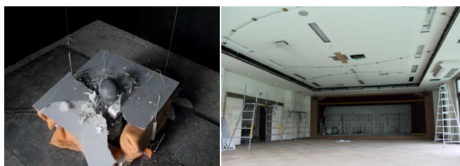
天井材落下実験による 安全性評価