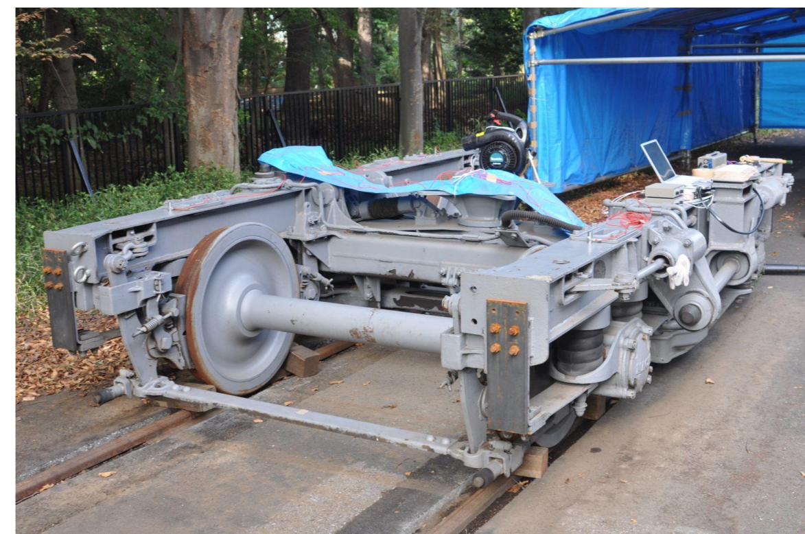
ICAによる鉄道台車の振動解析