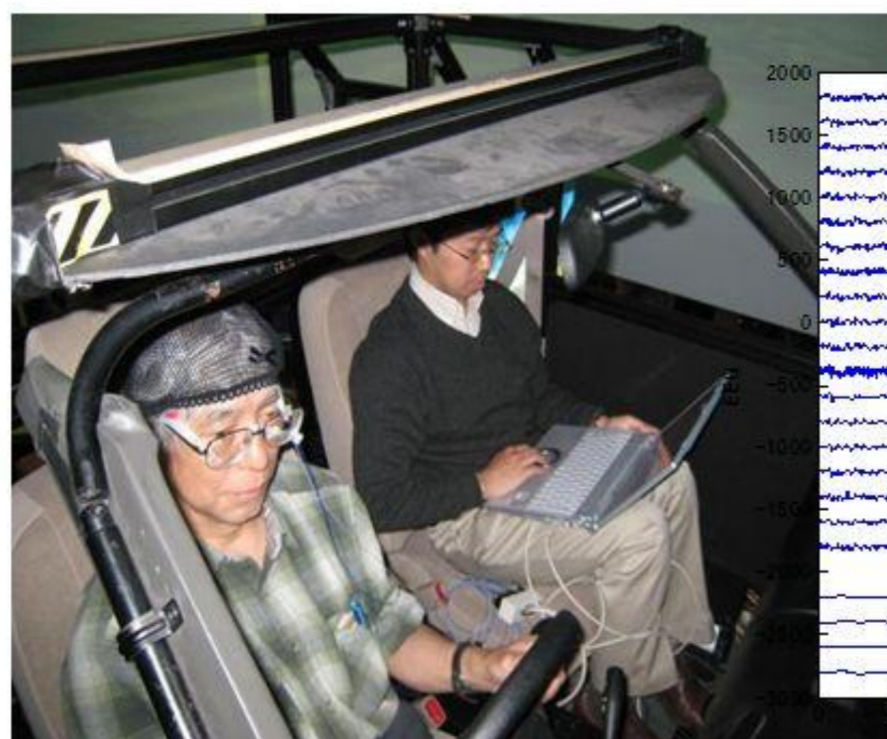
脳波解析実験の様子