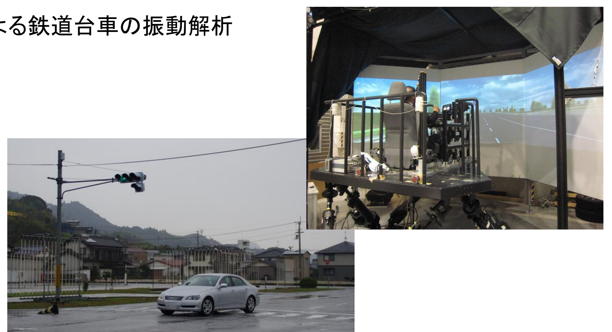
高齢者の運転特性計測