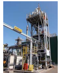
自己熱再生概念図(左)、自己熱再生実証実験装置(右) 新日鉄エンジニアリング 北九州環境技術センター内