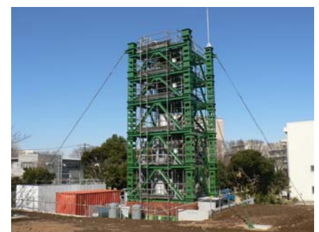
千葉実験所 大型循環流動層コールドモデル (高さ16 m, 直径0.10 m)

高効率石炭ガス化発電システムとして、石炭を低温でガス化し、ガス化に必要な熱は高温ガスタービンや燃料電池の排熱を蒸気として再生利用する「エクセルギー再生型次世代ガス化高効率発電システム (Advanced-Integrated coal Gasification Combined Cycle/Integrated coal Gasification Fuel Cell combined cycle (A-IGCC/IGFC))」を提唱してきた。このプロセスの実現のために、①高効率化を図るガス化炉・ガスタービンのインテグレーション手法②コールドモデルによる大量粒子循環システムの開発を行っている。