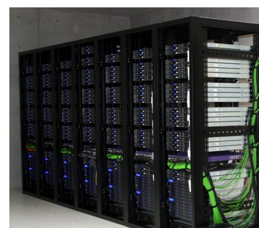
1000コアを越えるクラウドコンピューティング実験環境

大規模な計算機群から、必要な計算資源を必要に応じて即座に利用することができる「クラウドコンピューティング」を利用し、負荷変動や障害に頑健なアプリケーションを構築するための研究を進めている。特に、大規模探索などこれまでは適用が難しかった問題においても、オンデマンドな分散計算が容易に行えるような基盤技術の確立を目指している。