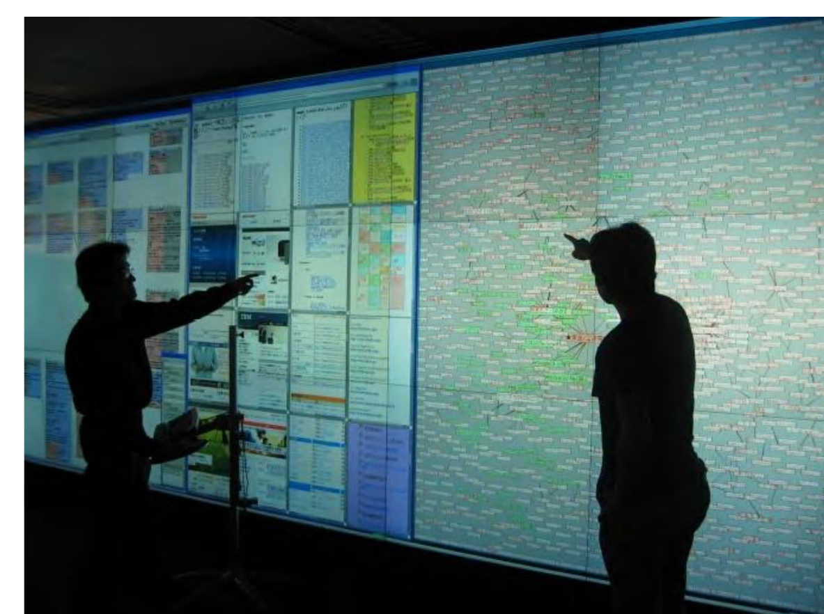
ディスプレイウォール上のサイバー地図可視化システム

約10年にわたり継続的に日本の全ウェブページを収集、およそ160億ページのウェブアーカイブを構築しており、その空間的特徴・時系列的変化を検出するアーカイブ解析システムを開発中である。これら膨大なウェブ情報から独自のリンク解析手法によりサイバー空間地図を作成し、情報の相互関係を直感的に把握し、自在な操作が可能な可視化システムを構築、大規模ディスプレイウォール上に実装している。