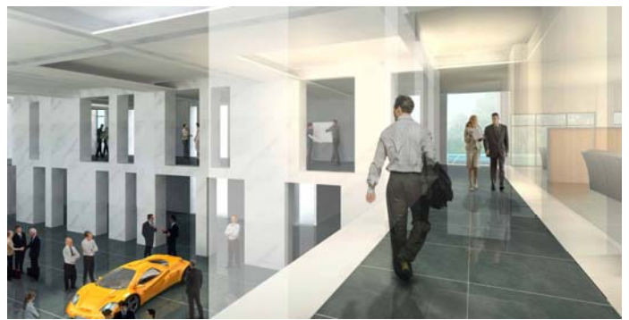
古い実験室を展示ホールにコンバージョン