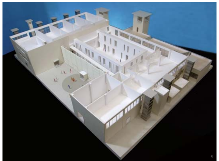
増築による回廊形式の完成