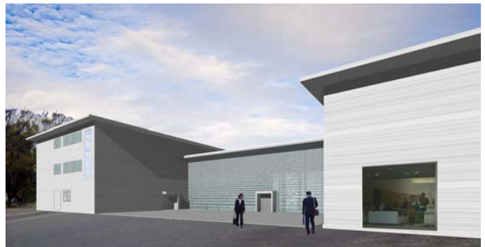
ファサード・レトロフィット