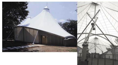
地中熱利用空間システム実験施設