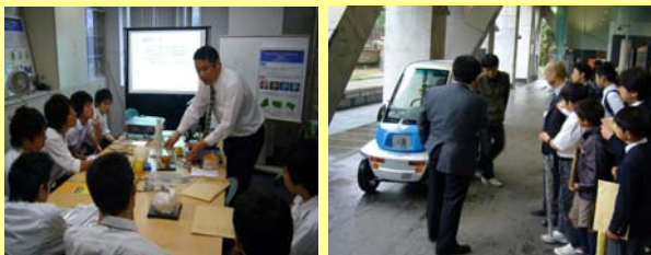
「未来の科学者のための駒場リサーチキャンパス公開」