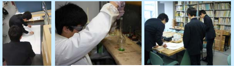
高校生の研究活動の様子