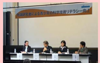
2009年シンポジウム 「先端研究者による青少年の科学技術リテラシー向上」