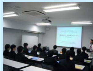
受講生ガイダンスの様子