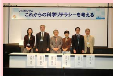
2008年シンポジウム 「これからの科学リテラシーを考える」