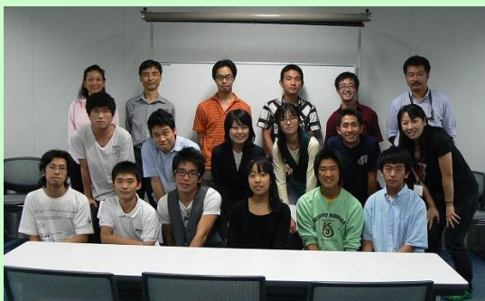
UROP履修学生と指導教員の記念写真