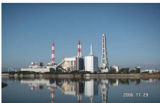
石炭ガス化複合発電 (IGCC)