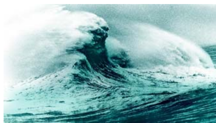
一発巨大波 Freak Wave