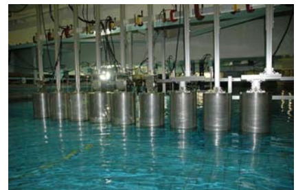
水産業に適した浮消波堤