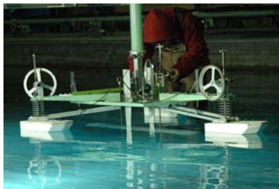
人工筋肉を用いた波エネルギー吸収船