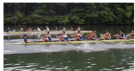
漕法の改良と漕艇用具の開発