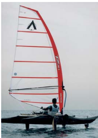
高速双胴水中翼ヨット TWIN DUCKS