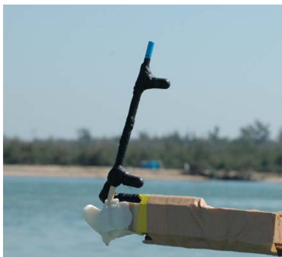
ステレオ式音響データロガー

注 3：独立行政法人水産総合研究センターが、マリンマイクロテクノロジー社、リトルレオナルド社と共同開発した小型で長期間自動運転可能な超音波パルス記録装置のことで、イルカの発するソナー音を受信することで、装置から約300m以内のイルカの存在と方位を記録します。本プロジェクトでは、設置型による長期定点観測と曳航型による広域観測の両方を試みました。