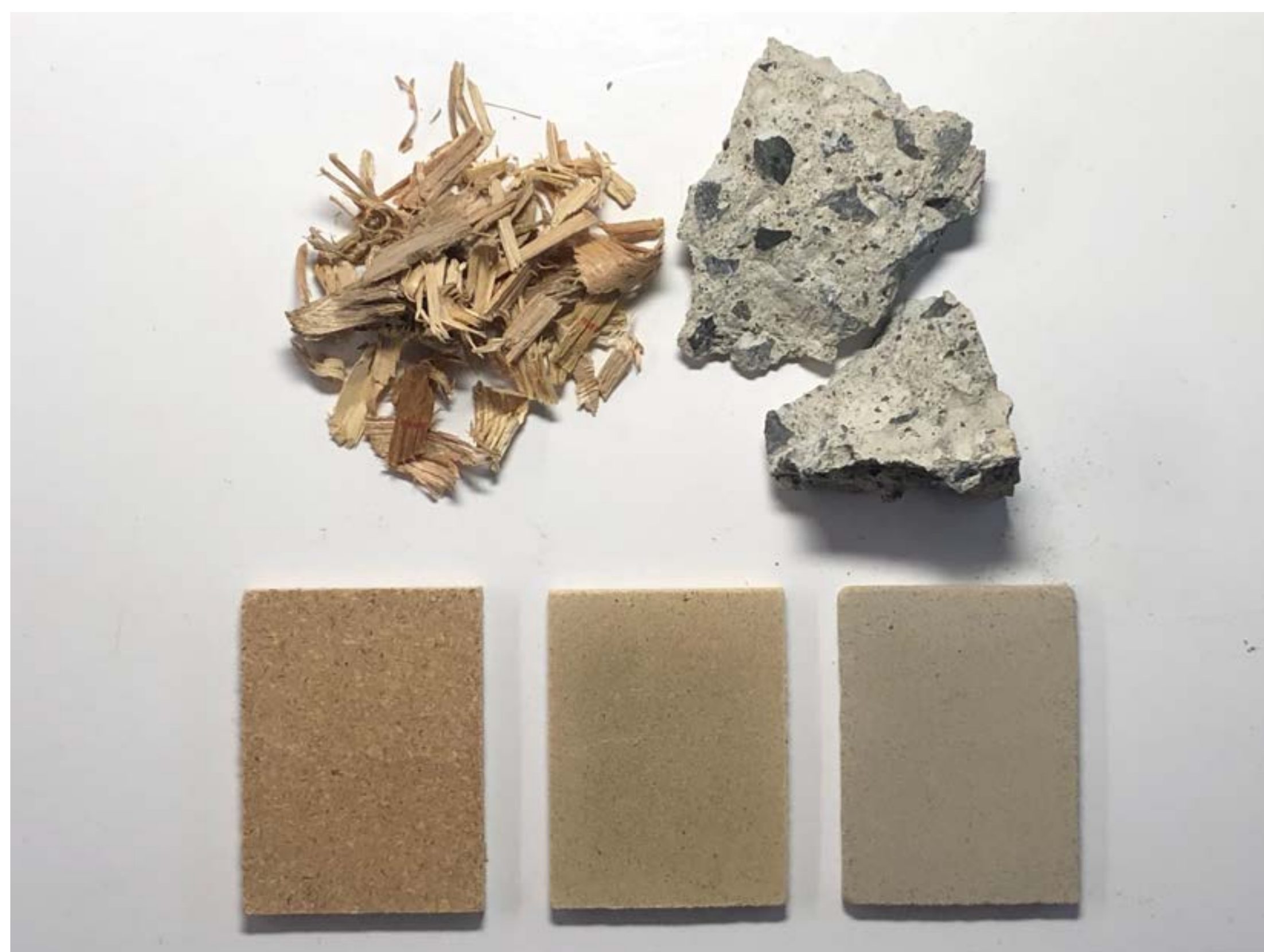
コンクリートがれきと 廃木材から作られたボタニカルコンクリート

コンクリートは砂と砂利をセメントと水で接着した材料ですが、世界のCO 2 排出の8%がセメント製造において排出されています。そこで、セメントを用いずに木材や植物で砂や砂利を接着する技術を開発しています。生分解性や植物の香りや色を付与することも可能です。コンクリートがれきの、リサイクルにも活用可能です。また原料によっては食べられる建設材料を作製することも可能です。