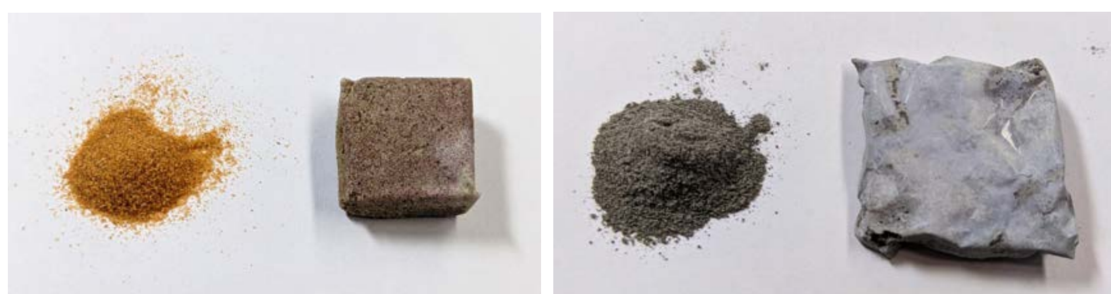
ナミブ砂漠の砂の接着

コンクリートの原料である砂や砂利、石灰石の不足が世界的に進行しています。触媒反応により砂と砂利を直接接合する方法を開発しています。通常は建設で使用できない砂漠の砂などの活用も可能になります。月面基地などの宇宙開発にも活用が期待されます。