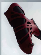
Rami : AM 製陸上競技用義足