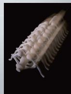
READY TO CRAWL

教育においても、これまでにないデザイン教育の拠点となることを目的とし、他大学の学生や社会人を実習生や研究員として広く受け入れ、プロジェクトを通じて、科学知識と美的感覚を併せ持つデザインエンジニアを育成することを目指している。