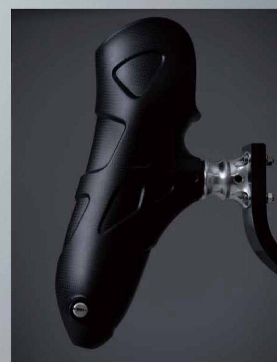
CR-1 : ドライカーボン製義足