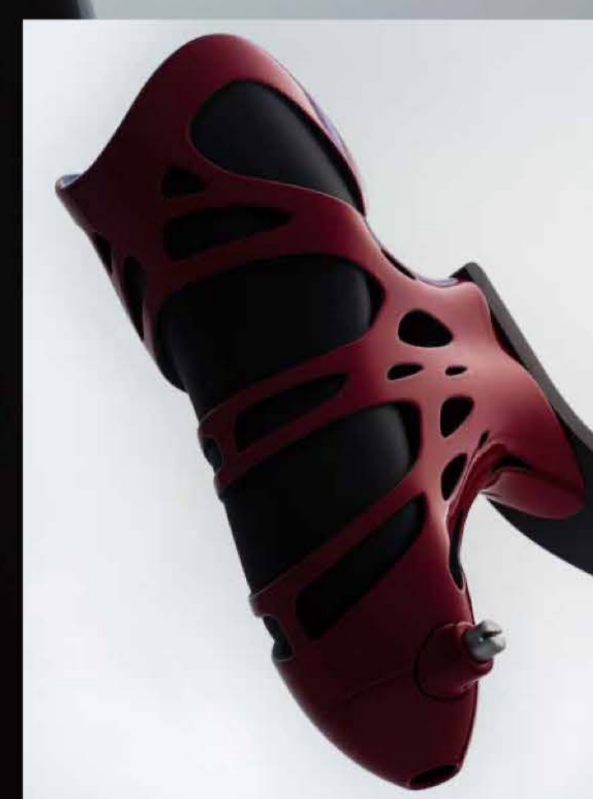
Rami : AM 製陸上競技用義足