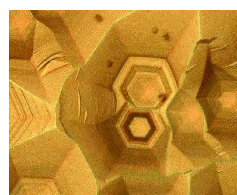
高温結晶成長界面の直接観察