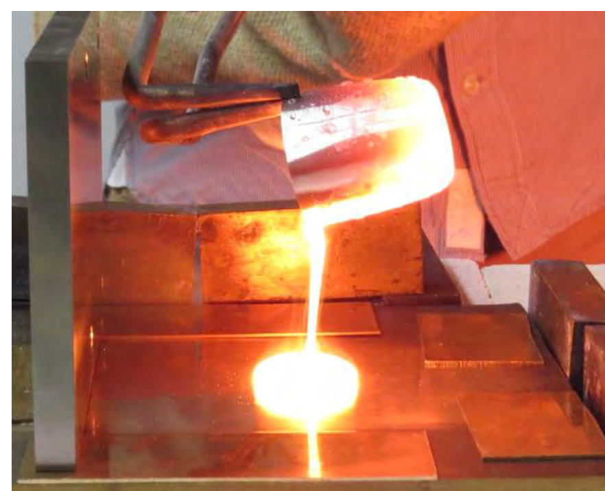
模擬廃棄物固化ホウケイ酸塩ガラスの溶融