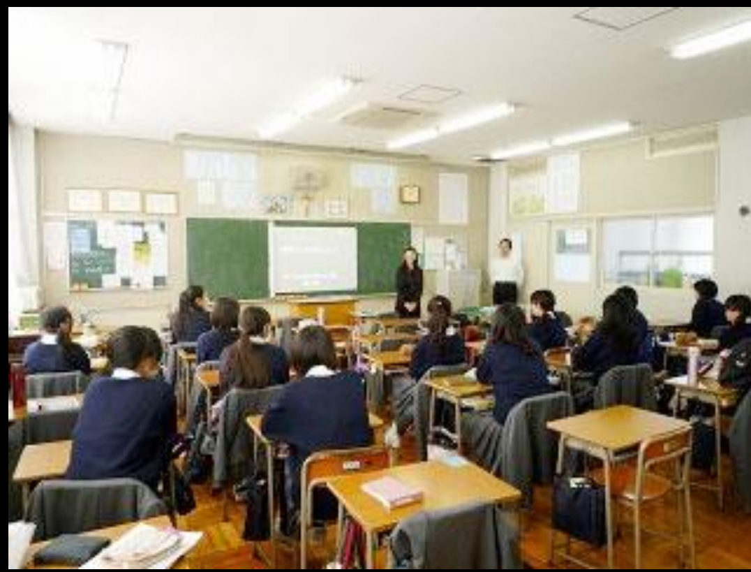
出張授業の企画・実施

生産技術研究所で行われている最先端工学研究を取り入れた産学連携による教育活動・アウトリーチ活動を企画・実施