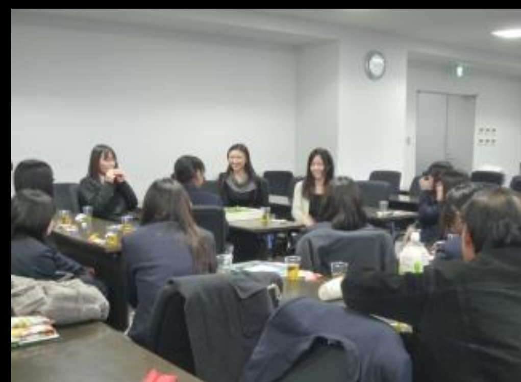
サイエンス・カフェ