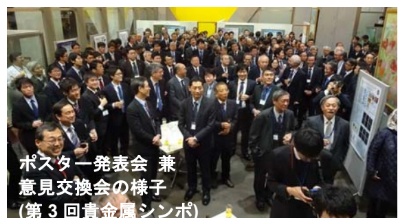
ポスター発表会 兼 意見交換会の様子 （第3回貴金属シンポ）