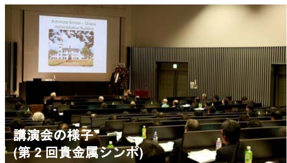
講演会の様子 （第2回貴金属シンポ）

4回目の開催となる今回は、7件の講演とポスター発表会を東京大学生産技術研究所にて開催します。