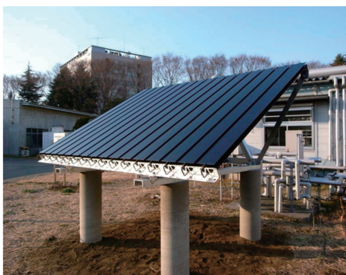
ソルエアヒートポンプ