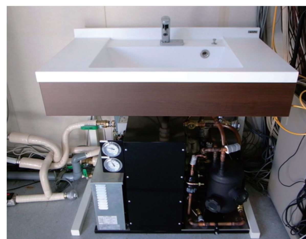
水熱源給湯ヒートポンプ