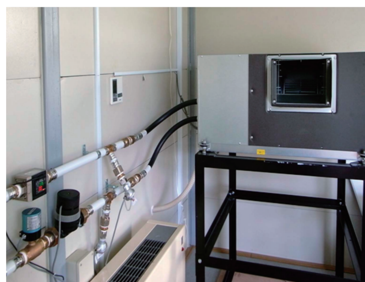
水熱源空調ヒートポンプ