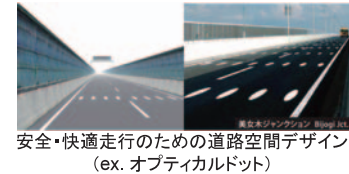
安全・快適走行のための道路空間デザイン (ex. オプティカルドット)