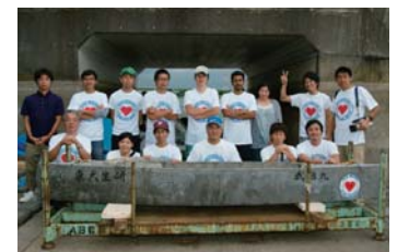
コンクリートカヌー大会 (自己治癒コンクリートで作製)