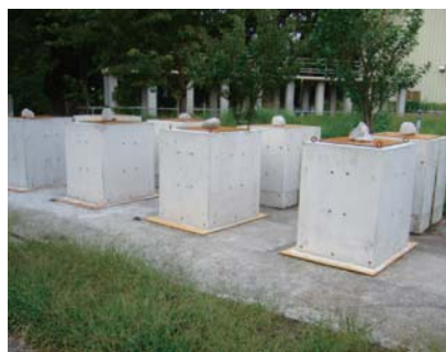
桁模型 (自己治癒性能の検証)