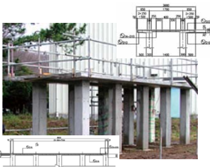
高架橋模型 (表層品質調査)