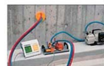
トレント法による表層透気試験