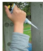
簡便な検査手法の開発 (流水試験)