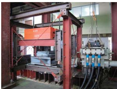
免震装置の性能試験

A new base-isolation device was developed, and evaluated by a large vibration table.