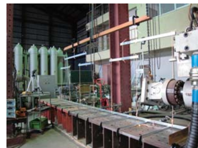
天井吊り金具の載荷実験