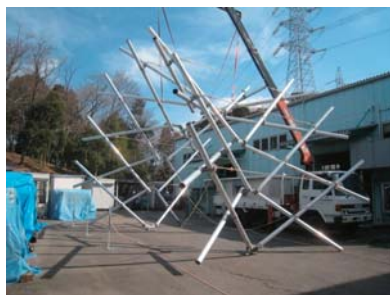
リユース型展開構造物の開発 Development of Re-Usable Deployable Structure

We have been researching and developing various buildings which practically use advantages of spatial structure.