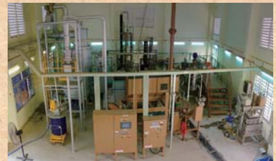
ホーチミン市工科大のバイオマス施設・プラント