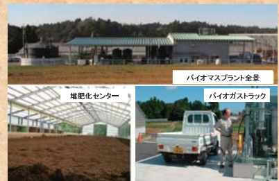
千葉県・香取市のバイオマス施設・プラント