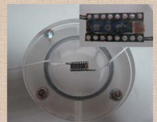
プレートレットカーボンナノファイバーを利用したアンモニアガスセンサー