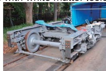
ICAによる鉄道台車の振動解析