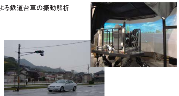
高齢者の運転特性計測