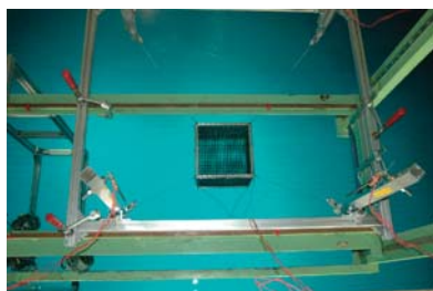
沖合型養殖設備関連実験