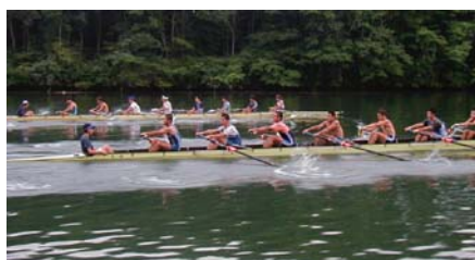
漕法の改良と漕艇用具の開発