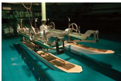
波エネルギー吸収船実験