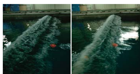
一発巨大波 (Freak Wave) 実験