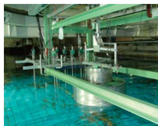
水産業に適した浮消波堤実験