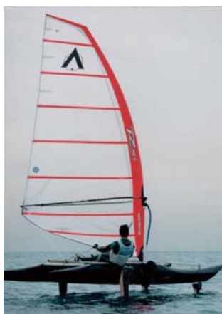
高速双胴水中翼ヨット TWIN DUCKS