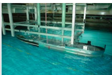
波浪中操縦性能実験