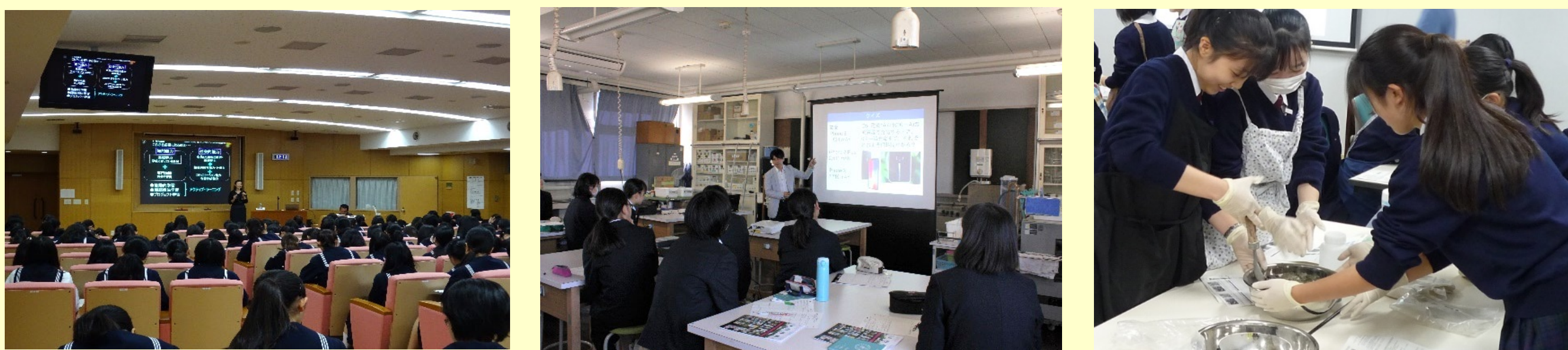
< 出張授業 >

SNG (Scientists for the Next Generation!!次世代の科学者を) では次世代を担う若い人たちに科学に興味を持ってもらおうと、さまざまなプロジェクトを展開