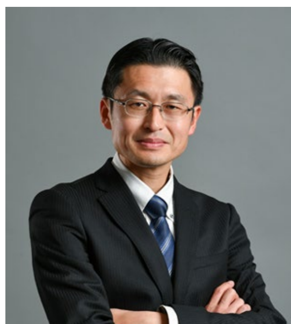
北澤大輔教授 (養殖漁業/海洋環境)