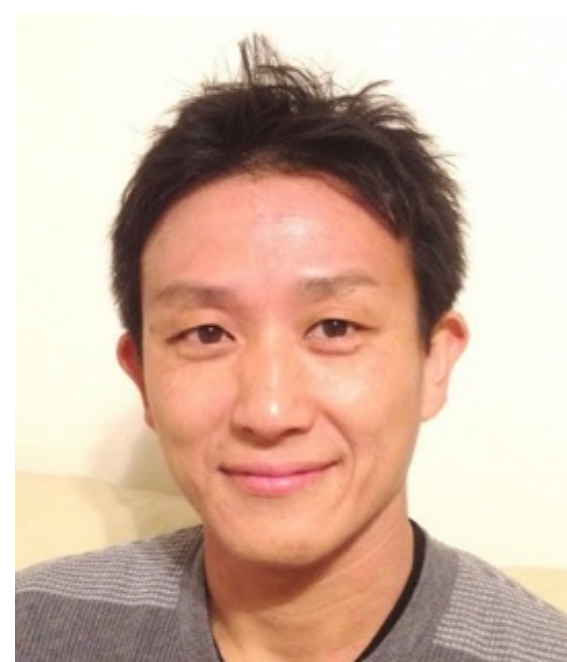
芳村圭教授 (水文・気象)