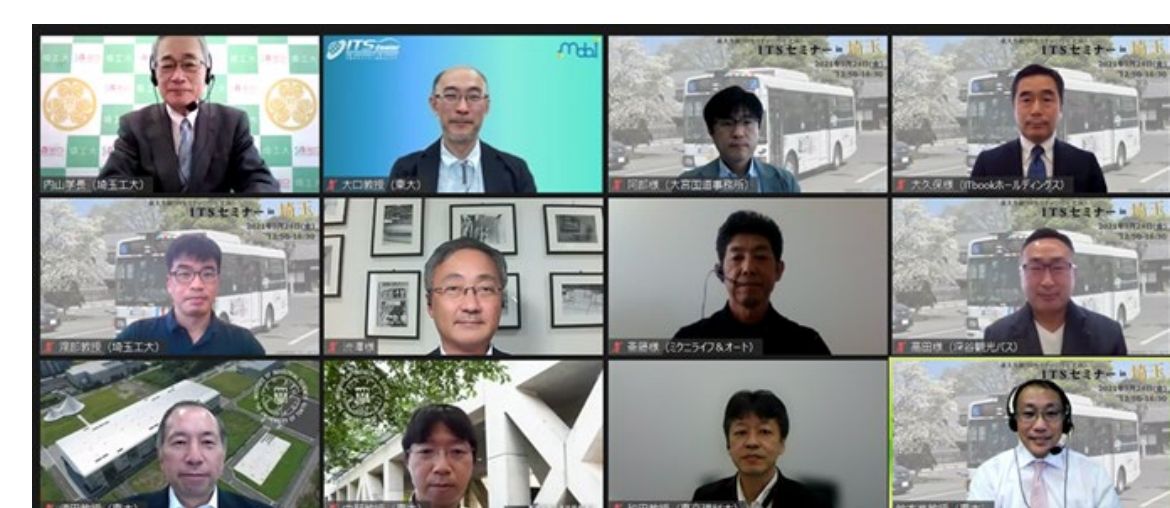
写真：ITSセミナーin埼玉（2021年9月）