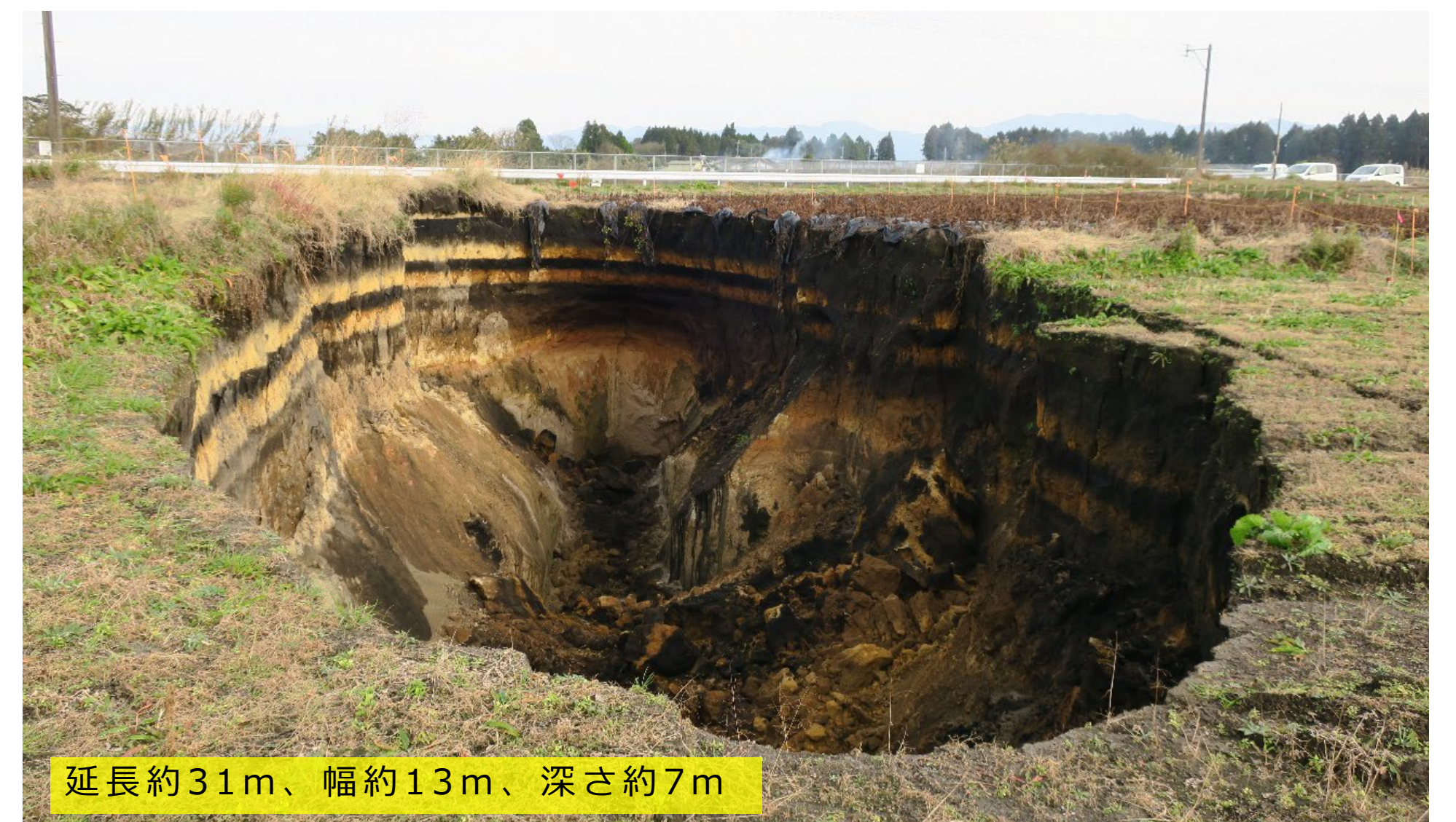
延長約31m、幅約13m、深さ約7m

地下の水みちに沿って地盤の一部が侵食され空洞の成長芽ができ 侵食が進んで空洞・ゆるみが成長 空洞天井部が崩落 それらを繰り返して空洞部が拡大しながら上方に移動