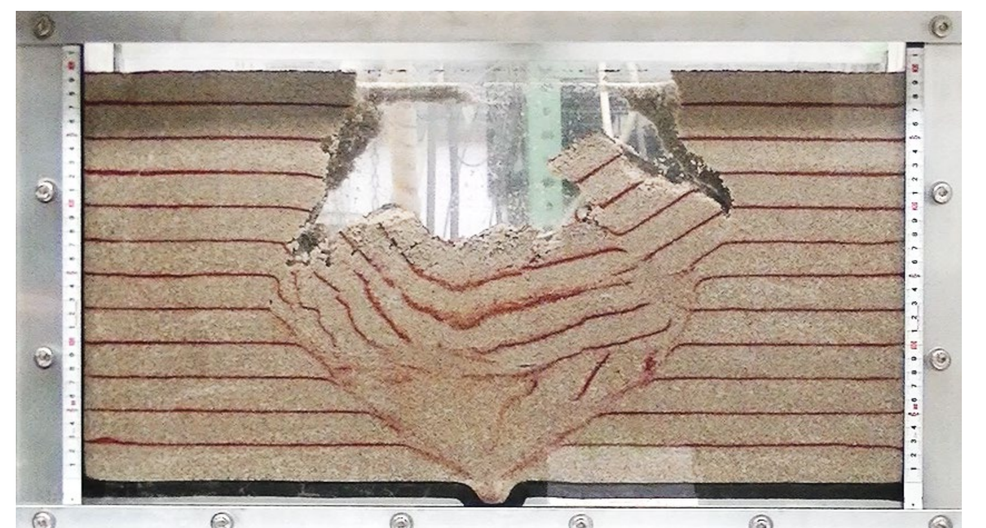
室内模型実験による、土砂流出、空洞生成・拡大、陥没メカニズムの再現

流出孔から地下水位以下の土砂が水と共に流れ出し空洞が生成・拡大 空洞天井部が地表面近くまで達し、空洞上部が不安定 空洞上部の土が崩落し陥没