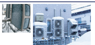
寒冷地での空調機室外機への着霜・着雪の例

https://www.daikinaircon.com/shop/office/products/sugodanzasasjp2.html https://www.daikinaircon.com/kaneichi/specialreport/index.html