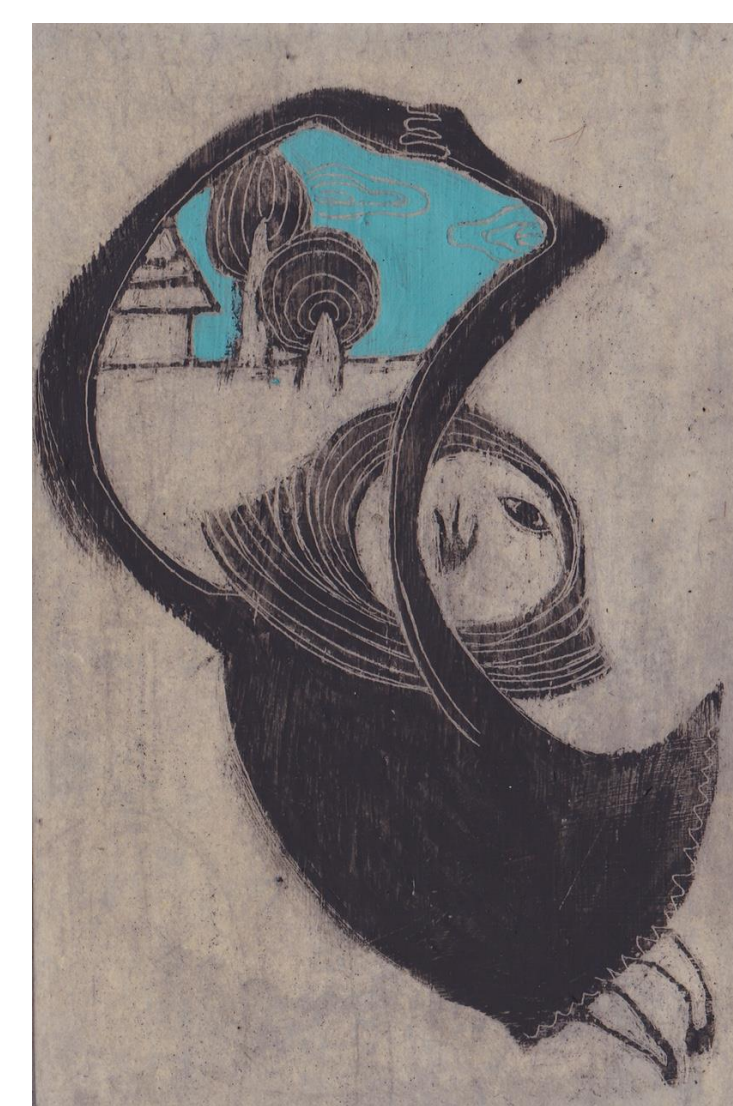
図1 ホモ・フェネストラートル

マドは、人間と環境との相互作用を、物理的に、あるいは非物理的に制御する装置である定義すると、実は、マドを作るという行為こそが、現代の人間の在り方を象徴しているのではないかと私たちは考えている。そこで、ラテン語の窓を意味する「fenestra」に作るひとという語尾「ator」を付け、「homo fenestrator」(ホモ・フェネストラートル/マドを作るひと)を、この時代の人間の本質を示す種名として提示したい(図1)。