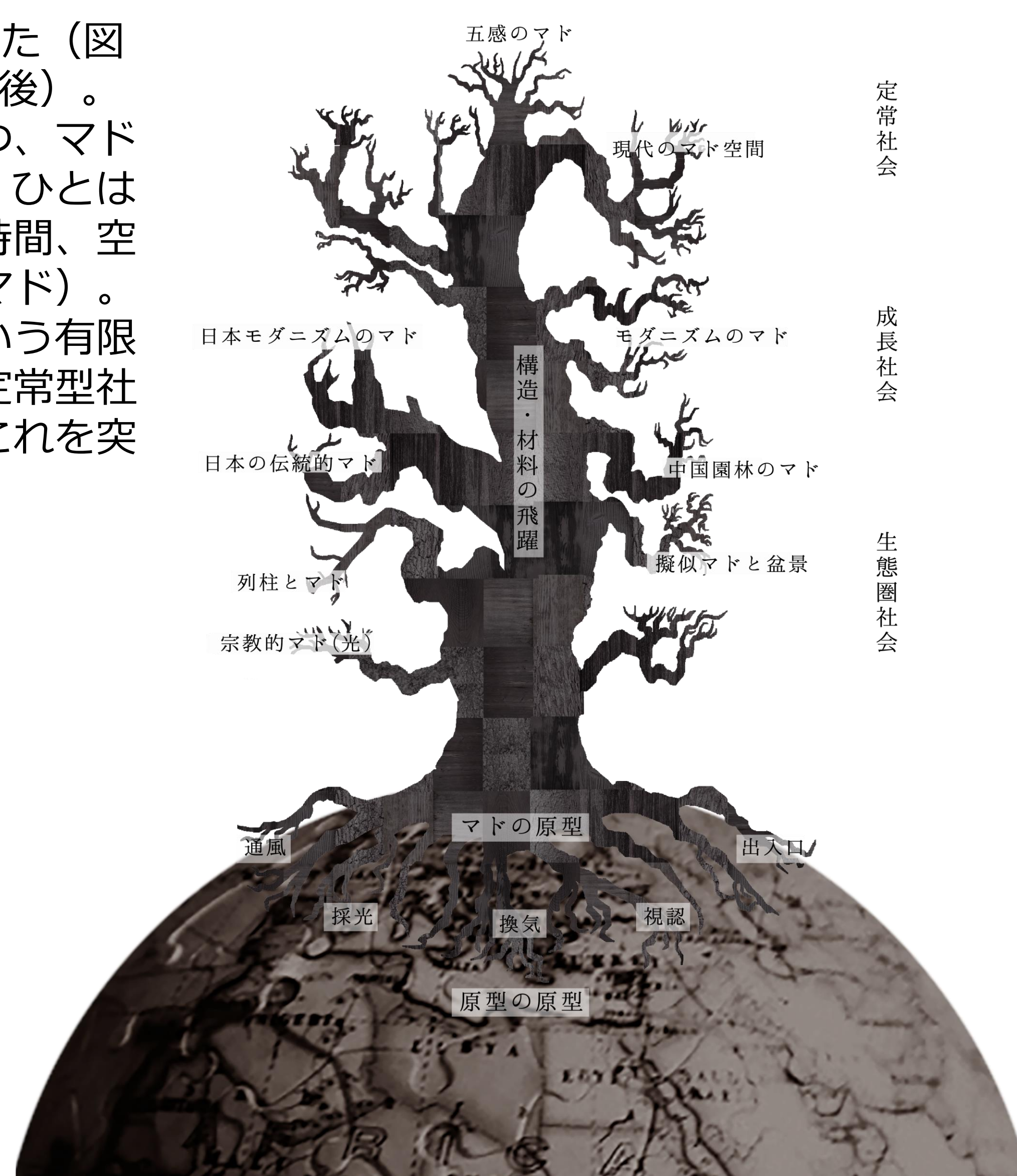
図2 マドの進化系統樹