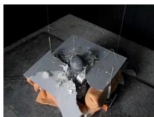
天井材落下実験による 安全性評価