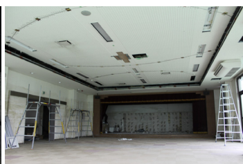
ケーブルによる天井の補強