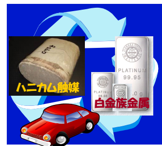
図2. 白金族金属を熔融銅に濃縮・回収するプロセスを研究