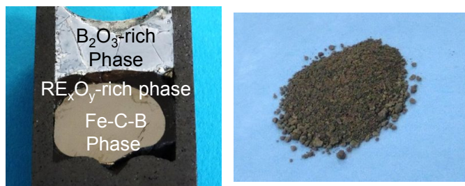
RE:(Nd,Dy,,Pr)-Fe-B-C-O系 回収された高純度希土類酸化物の三相分離