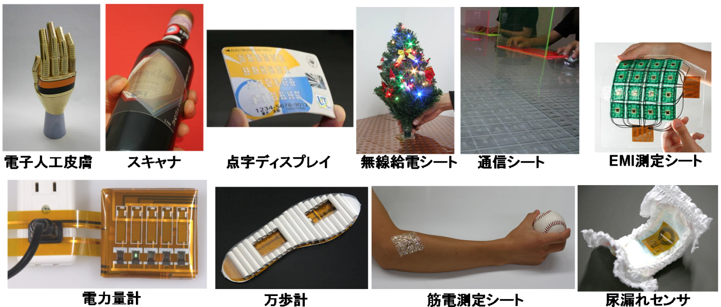
図1 有機トランジスタを用いた大面積・フレキシブルエレクトロニクス

半導体チップは情報ネットワークや携帯電話、テレビやオーディオなど現代の情報社会の基幹技術となっています。しかし近年、情報処理だけでなく、もっと物理的な世界にも応用が始まっています。環境全般、野山、街角、交通機関、ホーム、ボディなどにも半導体チップが入り込み安心・安全・豊かな生活を支えるために人々の生活に浸透するアンビエント・エレクトロニクスが実現しつつあります。そこで、本研究室では以下の研究を行っています。