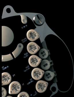
Tagtype garage kit (2004)