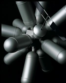
有人小惑星探査船 (2010)