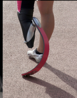
Rabbit Ver.4 (2012)