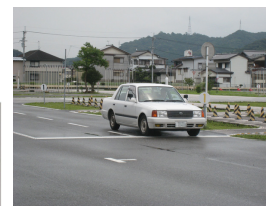
高齢者の運転特性計測