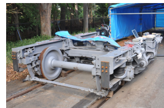
ICAによる鉄道台車の振動解析