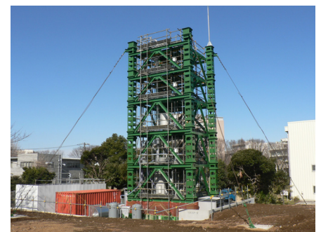
千葉実験所 大型循環流動層コールドモデル (高さ16 m, 直径0.10 m)