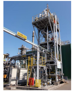
自己熱再生概念図(左)、自己熱再生実証実験装置(右) 新日鉄エンジニアリング 北九州環境技術センター内