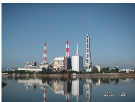
石炭ガス化複合発電 (IGCC)